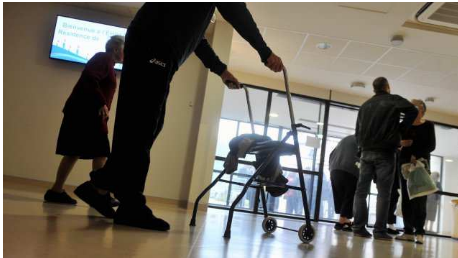
Illustration dans une maison de retraite

Avec un séjour mensuel moyen à 2361 euros en établissements d'hébergement pour personnes âgées dépendantes (EHPAD), Midi-Pyrénées arrive en 4ème position des régions les moins chères , selon un classement établi par Retraite Plus un organisme de renseignements sur les maisons de retraite qui indique notamment qu'il existe une grande disparité de tarifs d'une région à l'autre.