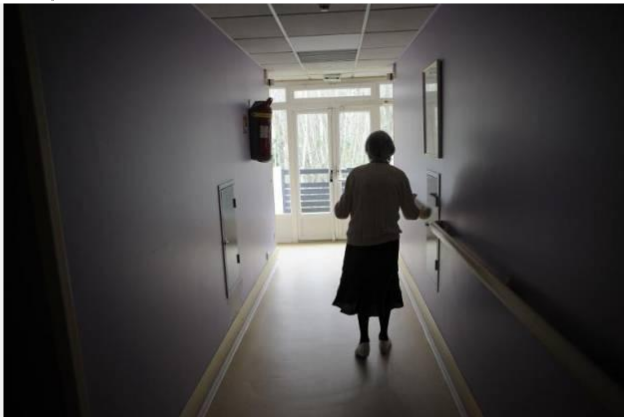
Une femme souffrant de la maladie d'Alzheimer marche dans le couloir d'une maison de retraite à Angervilliers, au sud-ouest de Paris, le 18 mars 2011

De fortes disparités de prix existent d'une maison de retraite privée à l'autre, selon les villes et les régions, l'Ile-de-France restant la plus chère, avec des tarifs allant jusqu'à 6.000 euros mensuels en 2015, selon une étude de Retraite Plus.