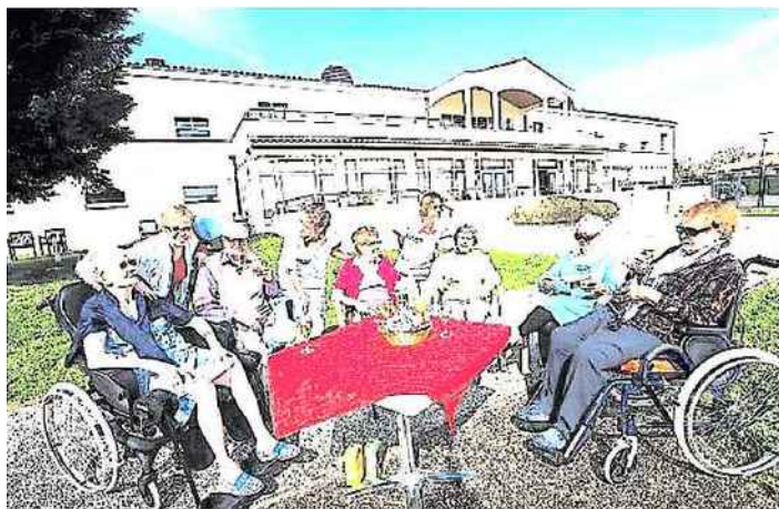
Les maisons de retraite investissent pour le confort des résidents.

« Le tarif soins », qui recouvre l'intégralité des dépenses de fonctionnement de l'établissement relatives aux charges du personnel. Il est directement versé à l'établissement par l'Assurance-maladie. Le résident n'a donc rien à payer, exception faite des consultations de médecins généralistes ou spécialistes de ville qui ne sont pas incluses dans ce tarif et sont donc à sa charge. Les règles de remboursement sont alors les mêmes que s'il vivait à son domicile.