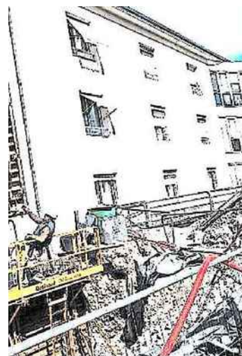
A Niort, la maison de retraite du Sacré-Cœur est en pleine rénovation.

83,2 % des personnes hébergées en Ehpad perçoivent l'Allocation personnalisée d'autonomie.