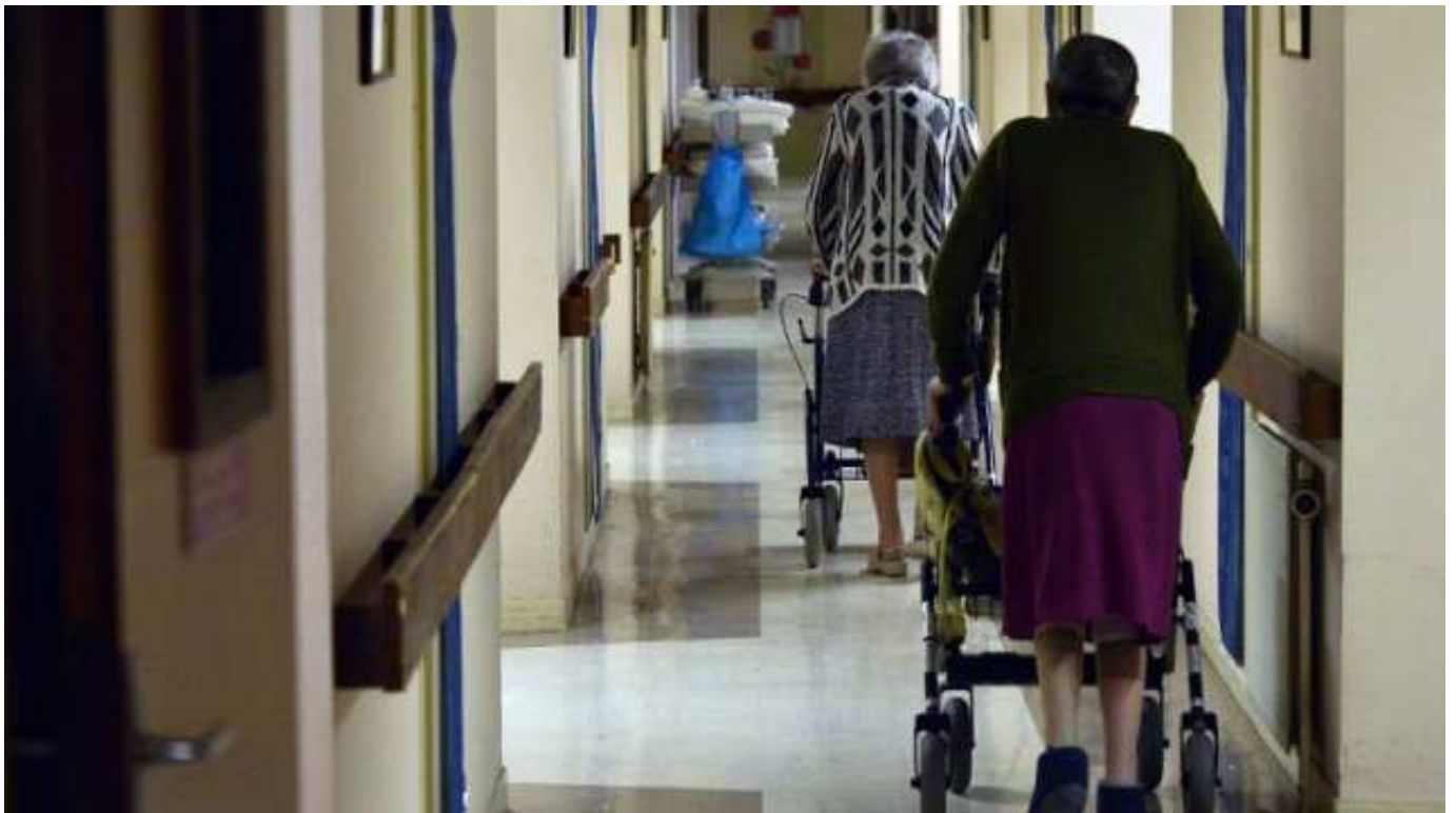
Résidents dans une maison de retraite (Archives)

En France, 592 900 seniors sont hébergés en Ehpad (Etablissement hospitalier pour personnes âgées dépendantes), avec une charge difficile à assumer pour la grande majorité d'entre eux dont la retraite est en général inférieure au coût mensuel d'un séjour, souligne cet organisme d'orientation en maison de retraite, qui publie ce mardi 19 mais les tarifs des établissements privés pour chaque région.