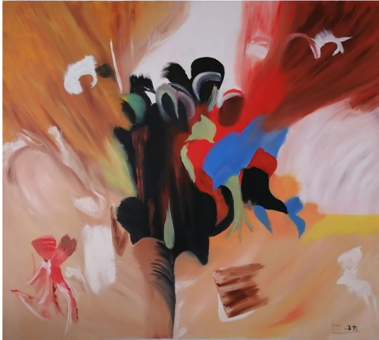
1er Prix du concours 2021 de Retraite Plus : oeuvre de Mme Schille, résidence Domitys la Palombine