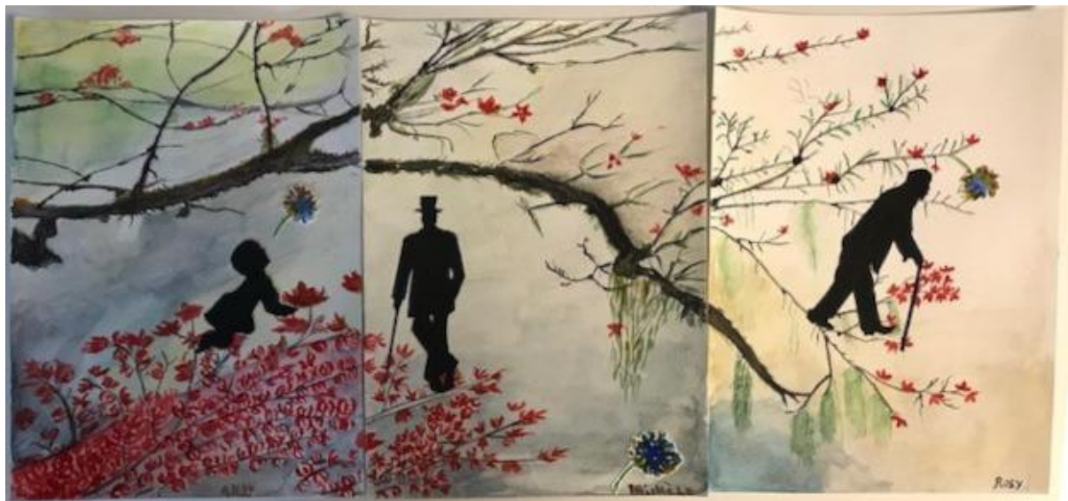
Une aventure réjouissante mais aussi thérapeutique pour les résidents d'EHPAD et de PASA

Animateurs, directeurs et participants se sont unis d'une même voix pour exprimer les bienfaits que le concours a apportés. Photos d'ateliers, témoignages de reconnaissance et