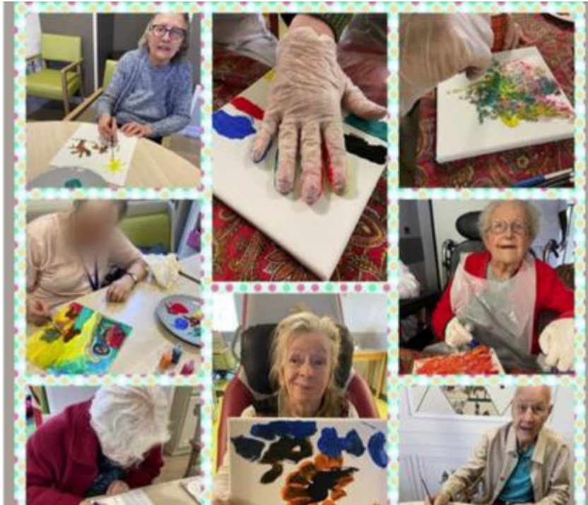
Résidents de l'établissement Korian Clairefontaine durant l'activité de peinture en préparation au concours.

Sabine Le Grand, collaboratrice administrative à l'EHPAD Résidence Saint Emilion a également mis en évidence plusieurs aspects thérapeutiques du concours de peinture et des activités artistiques en général pour développer les capacités cognitives mais également dans les relations sociales, avec les soignants, les accompagnateurs et les autres résidents : "Les résidents ont eu énormément de plaisir à participer à votre concours, une véritable bouffée d'oxygène pour les résidents mais aussi pour les soignants qui les accompagnent. Ces moments restent un magnifique temps d'échange entre les résidents et les soignants, autour de la création, permettant à chacun d'exprimer ses sentiments, ses frustrations, mais aussi de trouver un soutien auprès des autres résidents. Le développement sensoriel, comme par exemple, la manipulation des différents matériaux, ainsi que de retrouver des souvenirs et une capacité d'attention en se concentrant sur leur oeuvre."