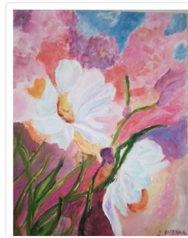
Œuvre de Jeanine Pierrat