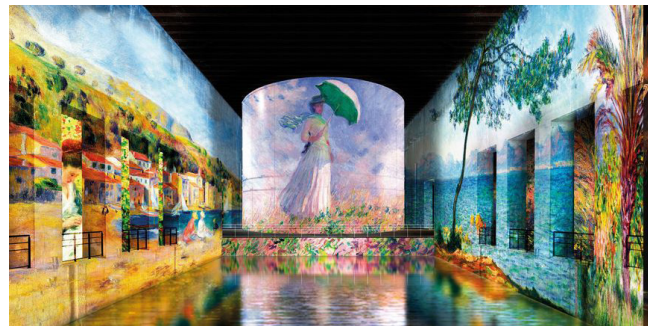
Claude Monet: Camille Monet et un enfant au jardin, 1875, Museum of Fine Arts, Boston ; Pierre-Auguste Renoir : Le Lavandou, 1894, collection privée ; Claude Monet : Femme à l'ombrelle tournée vers la droite, 1886, Musée d'Orsay, Paris ; Antibes, 1888, Samuel Courtauld Trust, The Courtauld Gallery, London ; Palmier à Bordighera, vers 1884, - collection privée